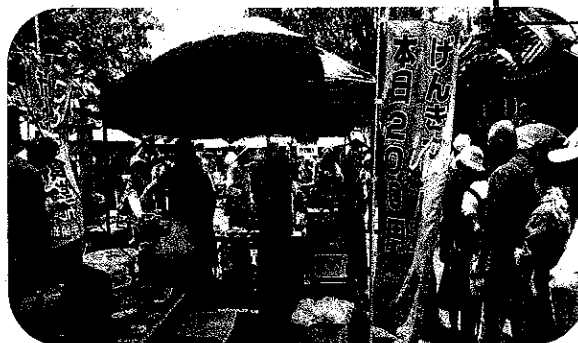
祭りイベント参加