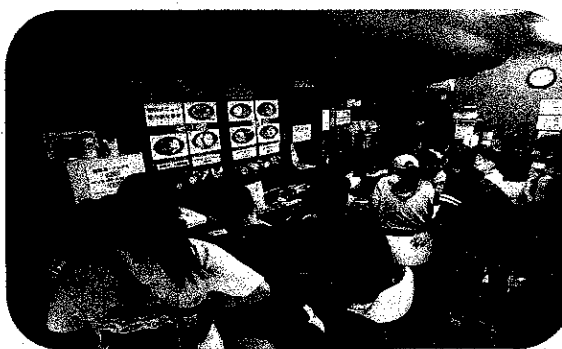
いつでも子ども食堂