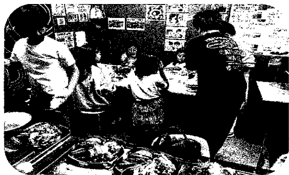
いつでも子ども食堂